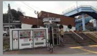
JR日豊本線大在駅 約850m・徒歩約11分