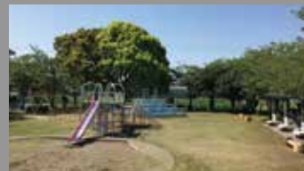
浜公園 約1100m・徒歩約13分