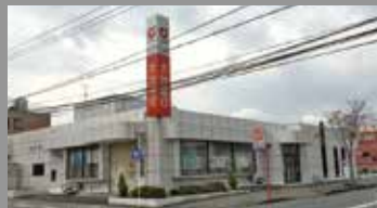
大分銀行大在支店 約1100m・徒歩約14分