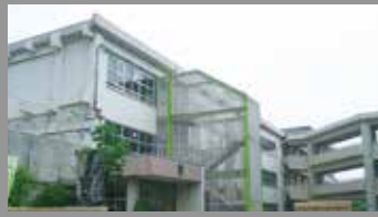
大在中学校 約600m・徒歩約7分