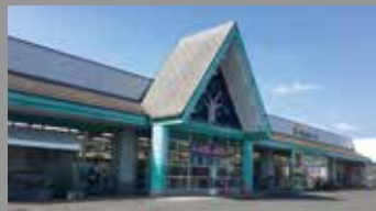
マルショク大在店 約400m・徒歩約5分