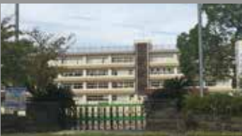
大在小学校 約1400m・徒歩約17分

国道197号線近く。利便性に富んだ周辺環境。 街中の喧騒から離れた、子育て世代に嬉しいエリア。